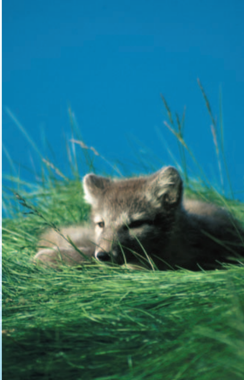
Песец в летнем «наряде».

Свалбард должен представлять собой один из наиболее эффективно управляемых природных регионов в мире. Одновременно, уникальная и нетронутая природа архипелага должна быть доступна для использования и познания. Поэтому любое передвижение по архипелагу должно осуществляться с особой осторожностью во избежание ухудшения качества или сокращения площадей охраняемых районов. Исходя из принципа «влияешь на природу – плати», различные природоохранные сборы обеспечат финансирование мероприятий по охране природно-культурных ценностей Свалбарда.