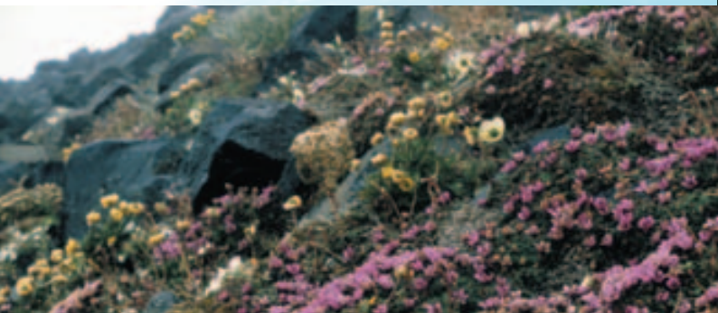
Летом на Свалбарде можно увидеть уникальный и богатый растительный мир.