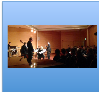
29.3 Historien om en soldat, Kammersalen, Barratt Due