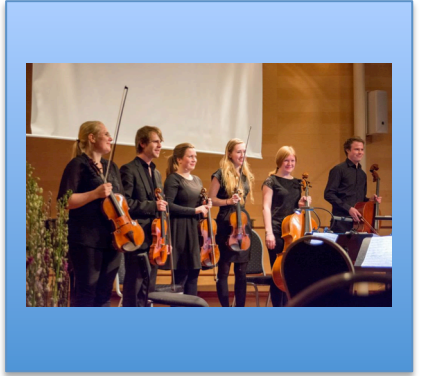
28.3 Verklärte nacht, Kammersalen, Barratt Due