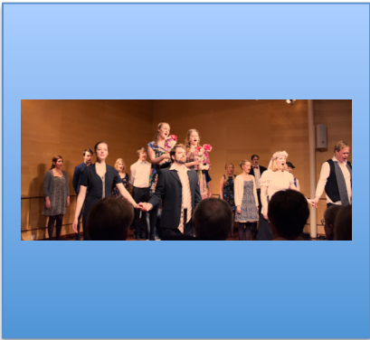
27.3 Figaros Bryllup, Kammersalen, Barratt Due