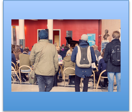
26.3 Lanseringskonsert på UiO, Blindern.