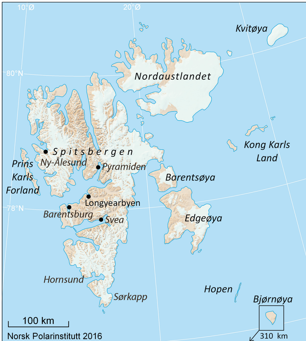
Figur 3.1 Kart over Svalbard