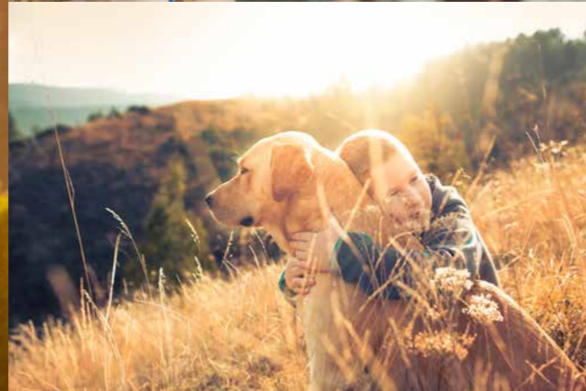
Alle foto: Mattilsynet og Istockphoto