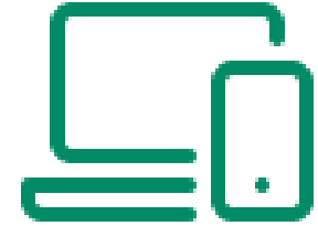
IKT og elektronikk