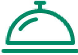
Mat og måltidstjenester