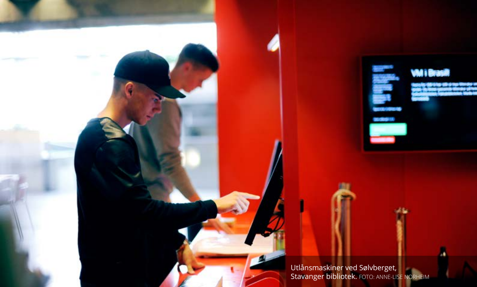
Utlånsmaskiner ved Sølvberget, Stavanger bibliotek.

vært «systematisk underfinansiert og nedprioritert». I Kulturutredningen ble det påpekt at satsingen på å utvikle nasjonale digitale fellesløsninger og tilbud om e-bokutlån ved folkebibliotekene har gått tregt. Kulturutredningen tok blant annet til orde for øremerkede midler til folkebibliotekene for en avgrenset periode, en mulighet for at fylkesbibliotekene kunne få en utvidet rolle i forvaltningen av tilskuddsmidlene og at staten skulle ta et større ansvar for å få fortgang og bidra til tekniske løsninger for hele feltet, samt gjennomføre nødvendige forhandlinger og rettighetsavklaringer. Kulturutredningen ble sendt på bred høring, der dette bildet ble nyansert og flere andre løsninger ble lansert.