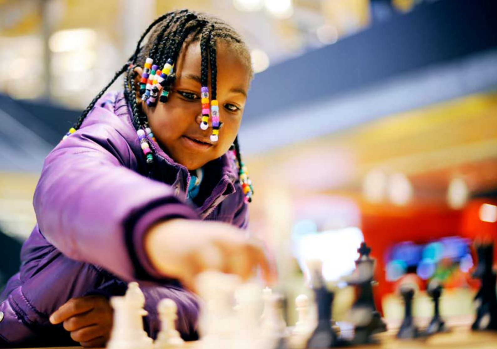
Bilde øverst: Sjakk i Superbiblioteket i 1. etasje i Sølvberget, Stavanger bibliotek. Bilde nederst: Stormen bibliotek i Bodø.