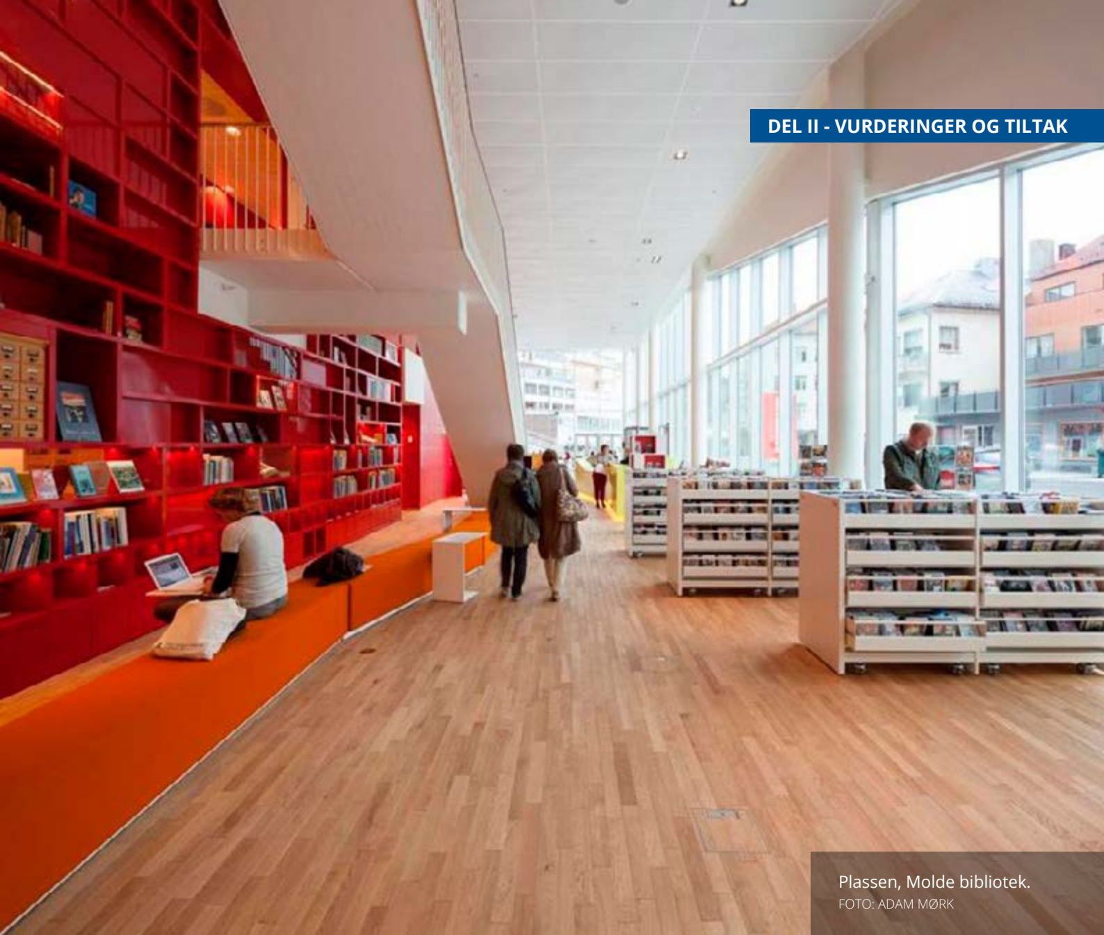
Plassen, Molde bibliotek.

fremforhandler konsortsieavtaler som bibliotekene kan velge å slutte seg til. Det er også anledning til fjernlån til brukere ved folkebibliotek. Det vil si at slike digitale ressurser kan søkes opp av folkebiblioteket og lånes ut utenfor biblioteklokalets vegger i papirform. Altså kan en låntaker få sitt folkebibliotek til å be om fjernlån av digitalt materiale, som kan sendes digitalt og skrives ut til låntakeren på papir. På denne bakgrunn mener departementet at der det er behov for tilgang til både digitalt og analogt materiale ved UH-bibliotek, vil dette være ivarettatt av gode samarbeid mellom bibliotekene i de to sektorene.