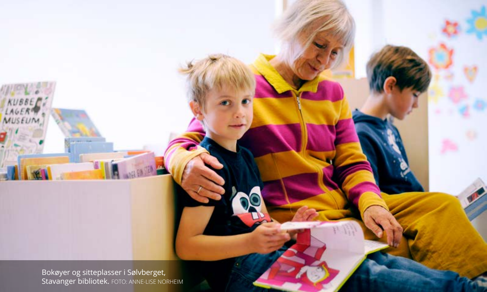
Bokøyer og sitteplasser i Sølvberget, Stavanger bibliotek.