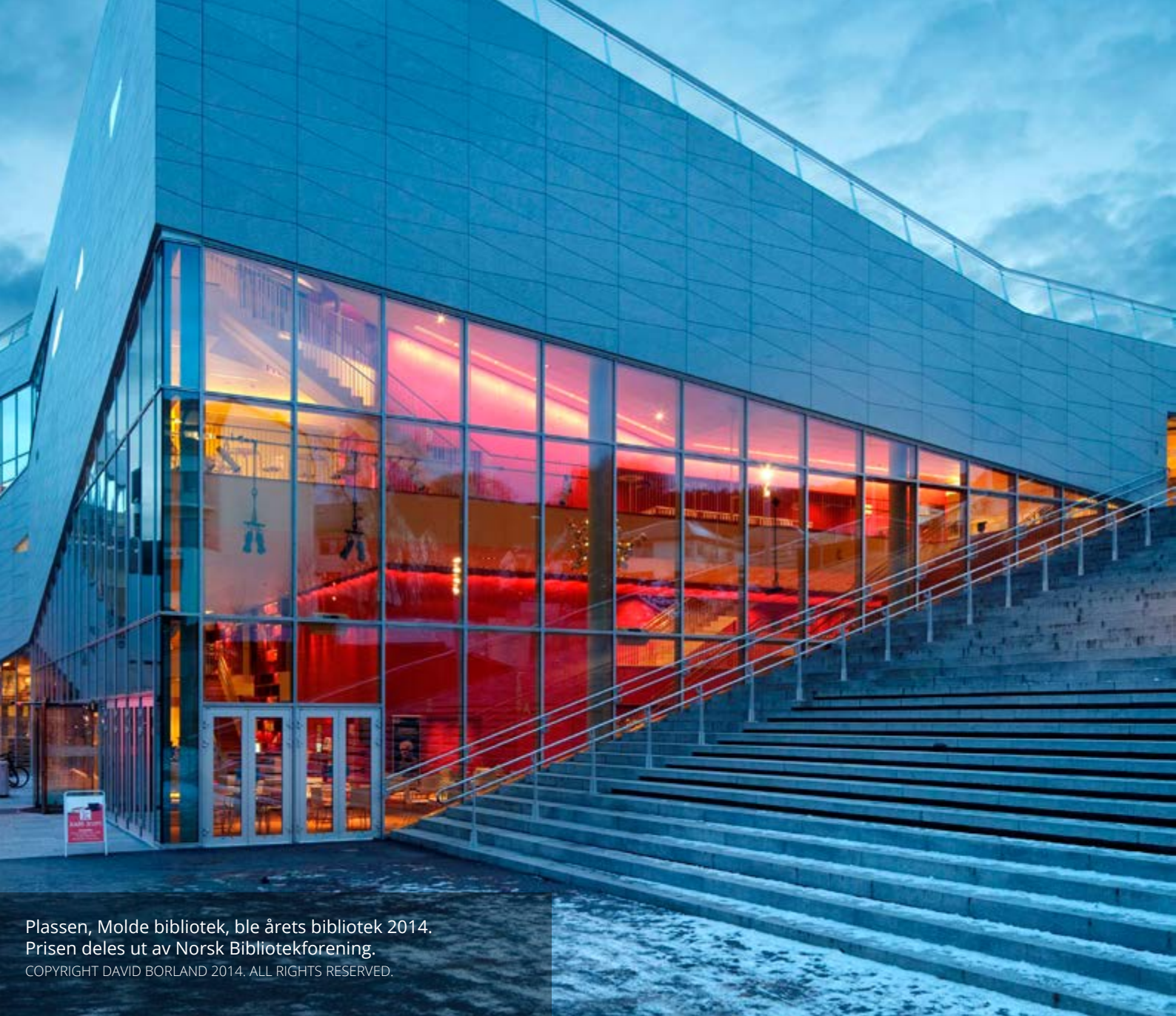
Plassen, Molde bibliotek, ble årets bibliotek 2014. Prisen deles ut av Norsk Bibliotekforening.