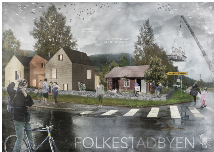
ILLUSTRASJON: FESTE LANDSKAP