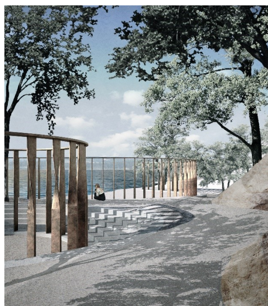
Figur 2: Minnstedet sett fra land- med Utøya i bakgrunnen. Ill: Manthey Kula arkitekter

Vannet og den varierende vannstanden er nært knyttet til minnstedet. Vannet i Tyrifjorden spilte en viktig rolle under angrepet i 2011. Når vannstanden i Tyrifjorden stiger om våren vil minnstedet gradvis flommes over og de nederste trinnene bli stående i vann. Siden navnene plasseres på søylene vil det altså være dager i året man ikke kan komme helt bort til hvert navn uten å måtte gå i vannet. Søylene er plassert på samme høyde, dermed vil vannet alltid stå like høyt på hver søyle.