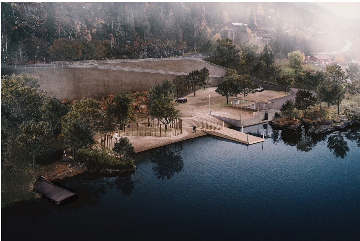
Figur 4: Oversiktsbilde av hele området. Ill: Manthey Kula arkitekter

Minnestedet og omgivelsene er utformet av arkitektene Beate Hølmebakk og Per Tamsen fra Manthey Kula arkitekter, i samarbeid med Landskapsarkitekt Bas Smets. De har formgitt et minnesteid med en konkret historisk referanse, men som samtidig både er vakker og ikke gir ett svar på det å minnes, men gir mulighet for refleksjon, tolkning og nyanser av menneskelige følelser. Manthey Kula arkitekter har hatt oppdragsansvaret siden 2018 og følger prosjektet videre gjennom byggeperioden for å sikre at kvaliteter og intensjoner blir godt ivaretatt.