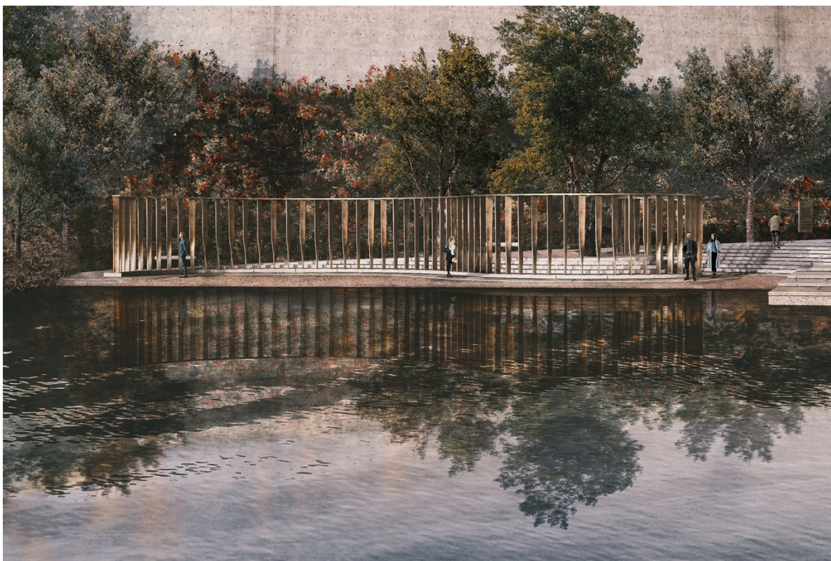
Figur 1: Minneste­det sett fra Tyrifjorden. III: Manthey Kula arkitekter

Minneste­det skal ligge ved stranden nord for kaia. Det består av en trapp som begynner i vannet der den danner en gjestebrygge til båtfolket på Tyrifjorden. Trappen fortsetter inn på land og buer seg slik at den danner to avgrensede plassrom mot vannkanten. På det nederste trinnet av trappen står det 77 smale søyler i bronse.