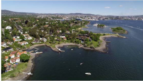
BYGDØY: Få steder er uberørt av mennesker langs Oslofjorden.

To sommerfuglarter er allerede borte. Biologer mener flere arter kan forsvinne dersom regjeringen åpner for mer bygging i strandsonen.