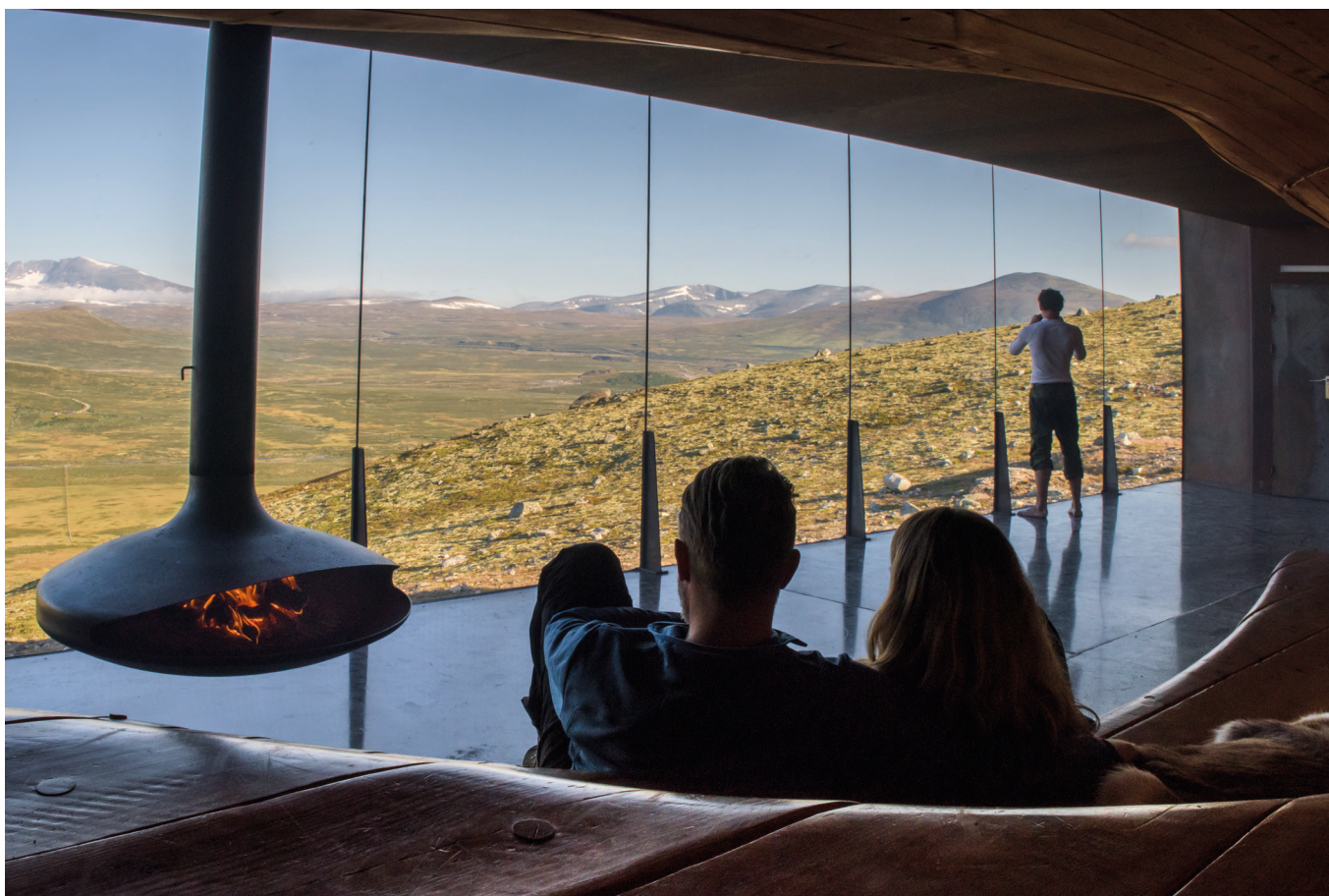
Viewpoint Snøhetta, Hjerkind, Dovre.