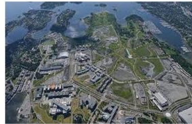
Fornebu - fra fly til by - Norsk ... kommunalteknikk.no