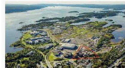
Obos og Aker skal bygge 45.000 kvm. på ... dn.no