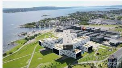
Norway Fornebu modern architecture ... youtube.com