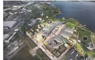
Har store planer på Fornebu - Estate ... estatenyheter.no