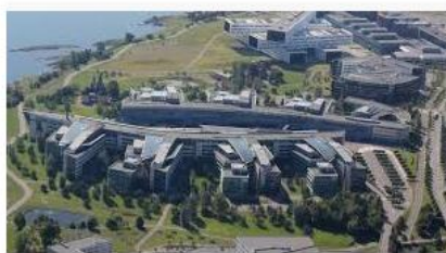
NRK på beforing hos Telenor: Kan havne ... budstikka.no