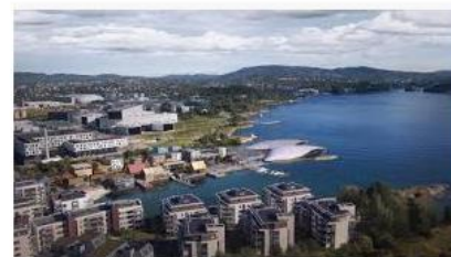
Selvaag Bolig selvaagbolig.no