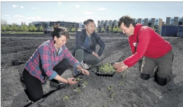
SPILDE SPILDER – Her skal det bli både epler og pærer, og en stor del av grønnsaker som selleri og kål. De er med på å gjøre det nye området på Fornebu til et nytt og spennende område for innbyggere.