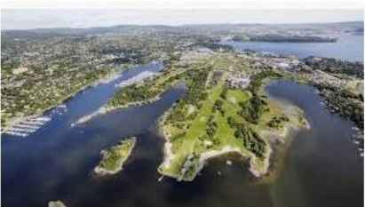
Fornebu 2018 - Botrend botrend.no