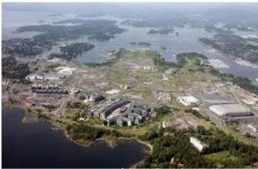
Fornebu – Wikipedia no.wikipedia.org