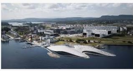
Fornebu kan få Nord-Europas største ... tu.no