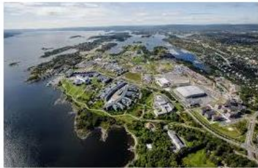
Fornebu – Nyebilder – Bildebyrå nyebilder.no