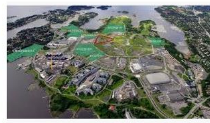
Boliger på Fornebu | Dyrvik Arkitekter dyrvik.no