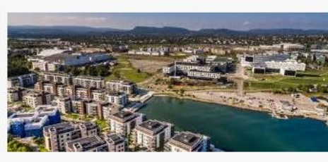
Fornebu et attraktivt område å bo ... eie.no