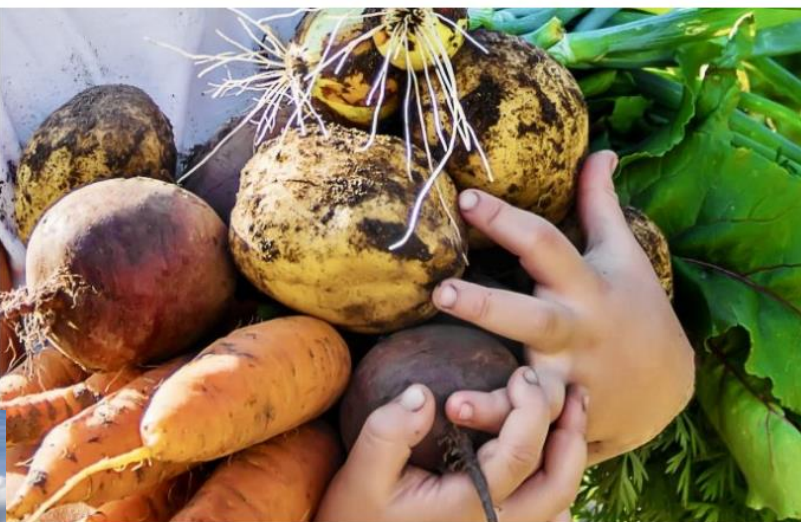
FELLESKJØPET, OBOS OG U-REIST gir folk muligheten til å dyrke mat på egen parsell.

Mange innbyggere i hovedstaden drømmer om en grønn flekk til å dyrke noe på, og nå er Felleskjøpet med på å skape 150 andelsåkere på et sju mål stort område på Fornebu.