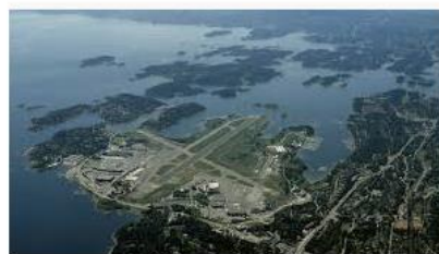
Fornebu: Der alt har gått galt e24.no