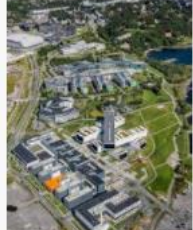
Flyfoto av Fornebu - Foto... nyebilder.no