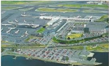
Oslo lufthavn Fornebu knuterikskarning.priv.no