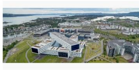
EiendomsMegler 1 Fornebu ... eiendomsme1.no