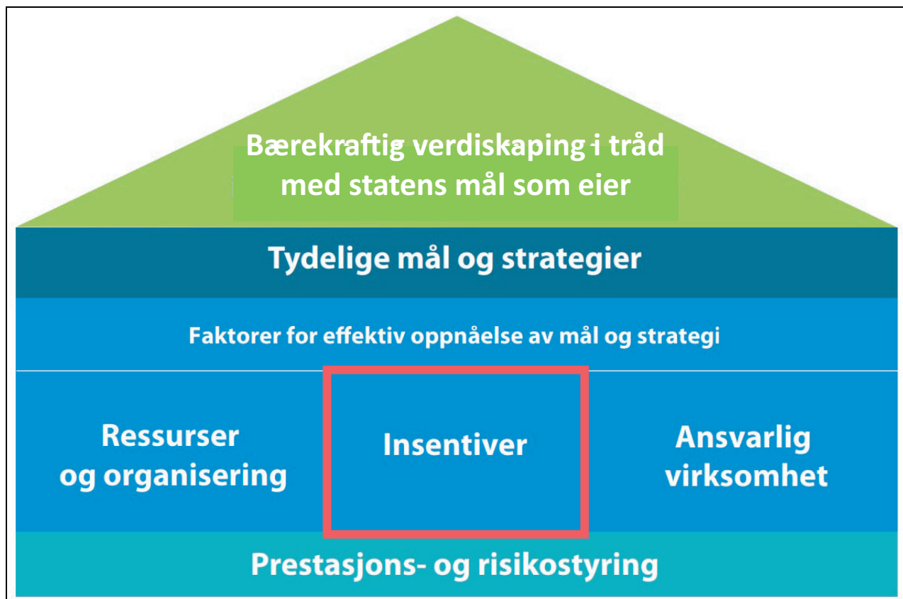
Figur 3.1 Forventningsområder innenfor selskapets virksomhetsstyring

relevant ved resultatavhengig godtgjørelse og incentivbaserte ordninger i form av bonus-, aksje-programmer e.l. For at resultatavhengig godtgjørelse skal kunne medvirke til oppnåelse av selskapets mål og bærekraftig verdiutvikling for eier, er det en forutsetning at det er en klar sammenheng mellom kriteriene for den resultatavhengige godtgjørelsen og selskapets mål og strategier.