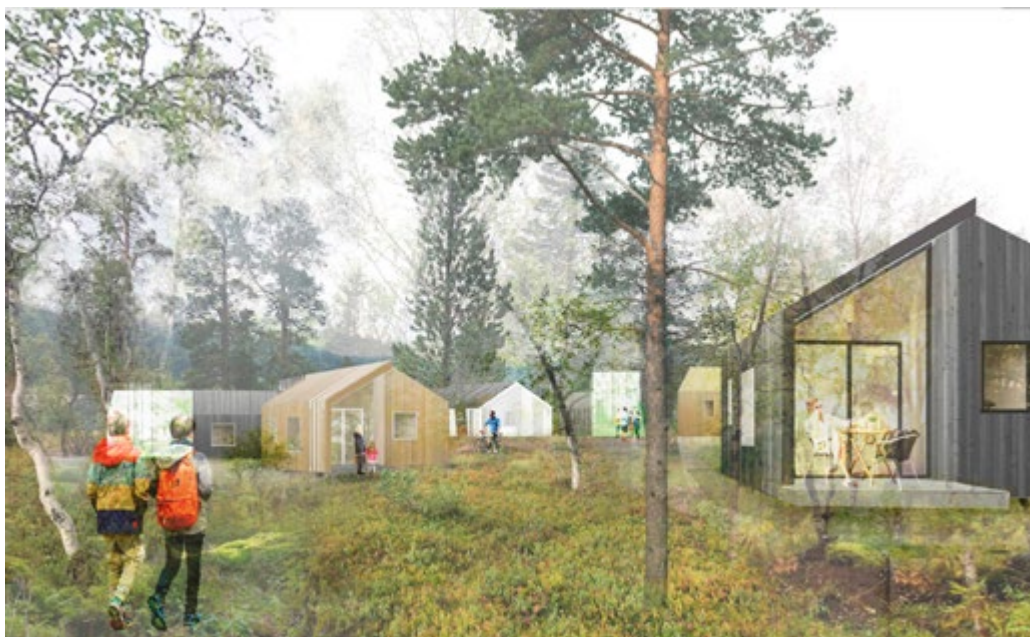
Åneggagrenda på Nerskogen, i Rennebu kommune kombinerer arealeffektive hytter med fellestenester som verkstad, utstyrsbod, drivhus, sauna, felleshus, gjesterom og bestilling av skysst frå togstasjonen. Illustrasjon: Pir II Arkitekter.

Gjennom prosjektet Berekraftig fritid har selskapet Grønn Fritid AS etablert eit prøveprosjekt der dei lanserer eit nytt hyttekonsept på Nerskogen, med vekt på berekraftige løysingar. Målet er å skape ein meir berekraftig hyttekultur, gjennom å utarbeide eit hyttetun med åtte små hytter og fellesareal.