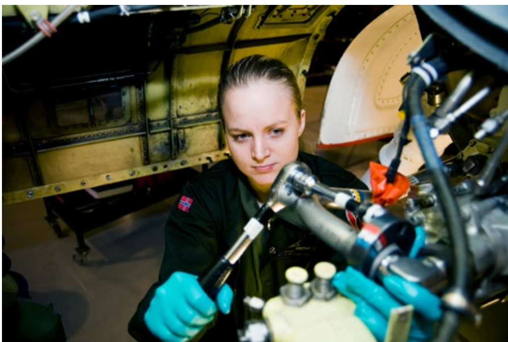
Luftforsvaret utdannar flyteknikarar til kampflya, helikoptera og dei maritime overvåkingsflya til Forsvaret.

kritiske samfunnsfunksjonar er avhengige av dei. Mellom 2014 og 2020 er 64 kommunar i Noreg inkluderte i programmet forsterket ekom der dei får forsterka mobilberedskapen sin. Tiltaket gir befolkninga og den lokale kriseleiinga eit område der mobildekninga blir halden oppe i tre døgn ved langvarige straumutfall. I 2020 blei 12 kommunar i Finnmark og 11 kommunar i Indre Agder inkluderte i programmet. Heile Finnmark er no med. I 2021 står fleire nye kommunar for tur.