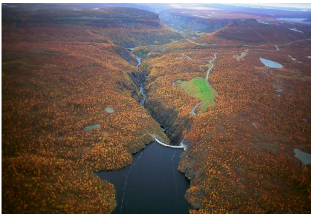
Kraftproduksjon er ei god inntektskjelde for mange kommunar. Utbygging kan samtidig føre til store endringar i topografi og naturmiljø. Her frå Alta.

innlandsområda har verdifull og variert natur, landskap og andre miljøverdier som det er viktig å ta vare på, og desse omsyna må vektast opp mot samfunnsnytta i utbyggingssaker. Digitalisering vil dramatisk auke tilgangen på data i næringa, og kan mellom anna gi meir effektiv og miljøvenleg drift av vasskraftanlegg og betre kunnskapsgrunnlag for nye løyve, knytt til framtidig auka bruk av vind- og vasskraftressursane. Bruk av energiressursar og bygging av nett gir naturinngrep. Derfor er det viktig at straumnettet blir nytta effektivt, at det ikkje blir bygt ut meir nett enn nødvendig, og at det skjer til ein lågast mogleg kostnad. Elektrifisering kan innebære at store forbruksaukar kjem raskt og kan gi behov for forsterkingar i nettet regionalt. Elektrifisering og utvikling av straumnettet er viktige tema i Meld. St. 36 (2020–2021) Energi til arbeid–Langsiktig verdiskaping fra norske energiressurser .