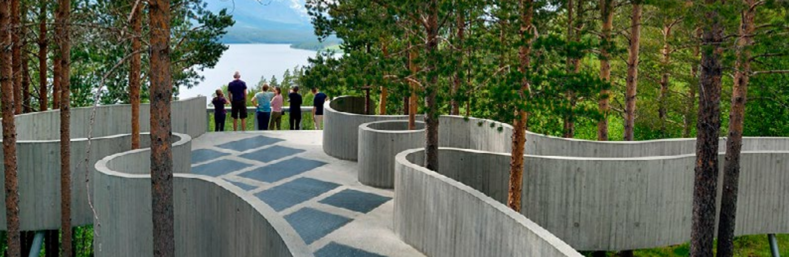
Sohlbergplassen utsiktsplass på Nasjonal turistveg Rondane, oktober 2018. Arkitekt Carl-Viggo Hølmebakk. Foto Werner Harstad, Statens vegvesen.