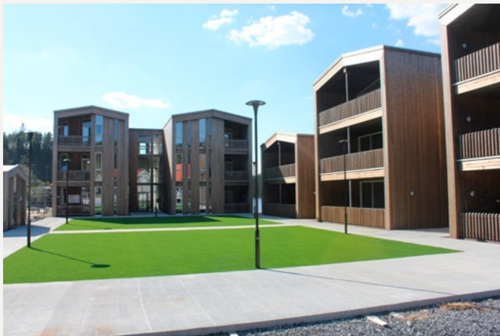
Birketveit landsbytn i Iveland kommune. Bygningsmasse i massivtre og underjordisk parkeringshus. Foto: Finn Terje Uberg. Arkitekt: Ola Roald Arkitektur.

Dei 10 andre kommunane som deltek i prosjektet, er Beiarn, Herøy (Nordland), Grong, Vanylven, Stryn, Ullensvang, Vinje, Våler (Innlandet), Kongsvinger og Engerdal.