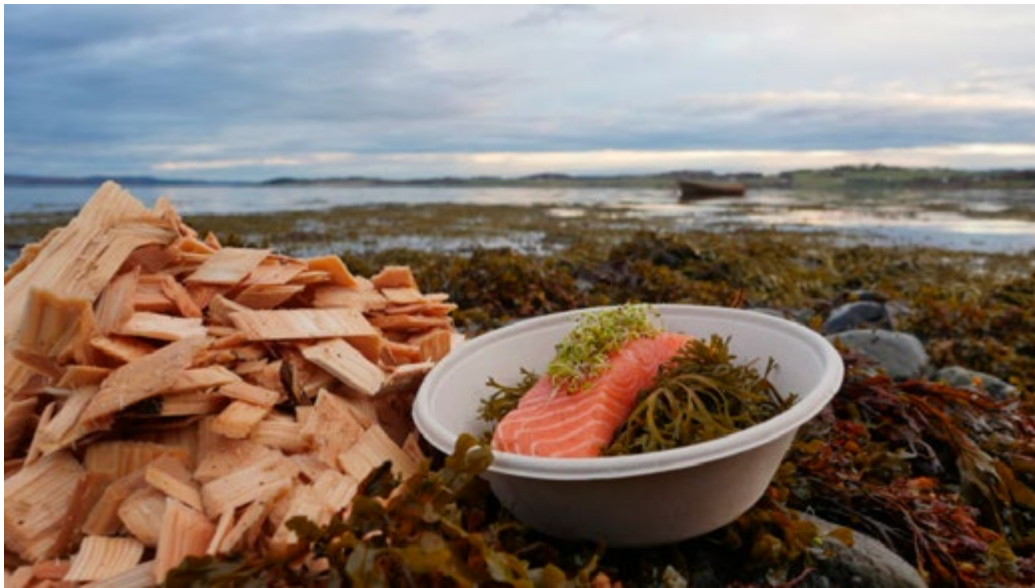
WoodWorks arbeider mellom anna for å nytte protein frå treflis til bruk i fiskefôr.