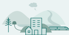
Del 3: Metode for utredning

Krav til innhold i plan- og utredningsprogram