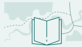
Del 2: Plan- og utredningsprogram

Veiledning til ansvarlig myndighet og høringsparter