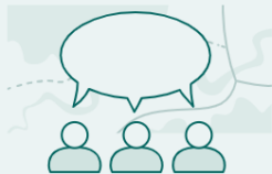
Del 1: Utredningsprosessen

Trinn-for-trinn-veiledning til å gjennomføre utredning