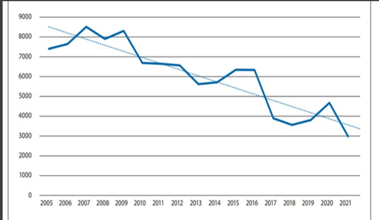
Figur 9.4 Omdisponert dyrka mark 2005–2021 med linje som viser nedadgående trend (dekar).