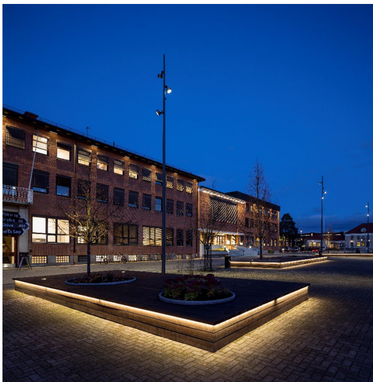
Sittekanter med vegetasjonsfelt