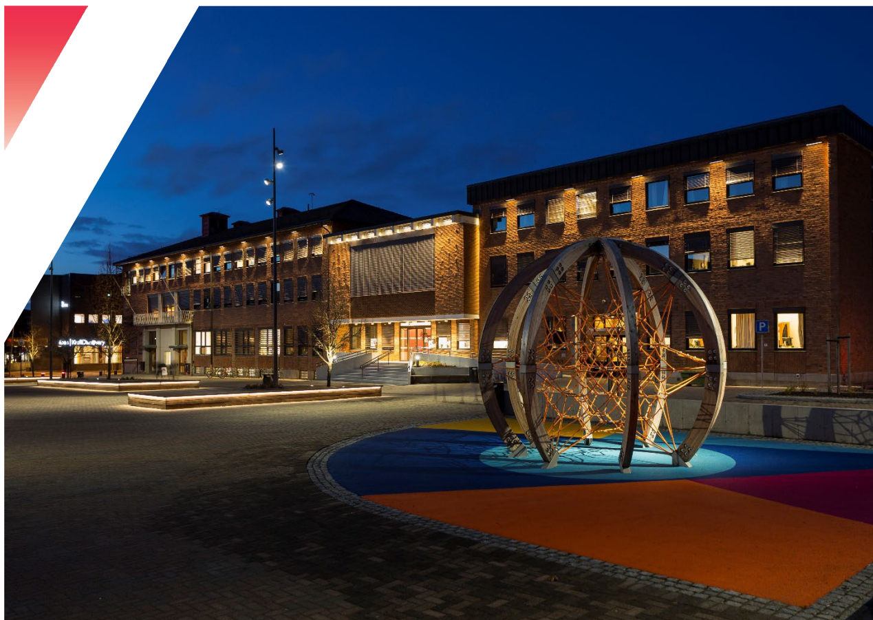
Rådhusplassen på Kongsvinger, med rådhuset i bakgrunnen

I forbindelse med en oppgradering av Rådhusplassen på Kongsvinger fikk Multiconsult i oppgave å utforme en overordnet belyningsplan for plassen. Torget brukes både som en ferdselsåre, og til arrangementer av ulikt slag, men plassen fremstod tidligere som mørk og var et lite attraktivt sted å oppholde seg på kveldstid. Dette ønsket kommunen å endre på, og de ønsket seg en belysning av plassen som stimulerte til opphold og aktivitet både til hverdags og fest.