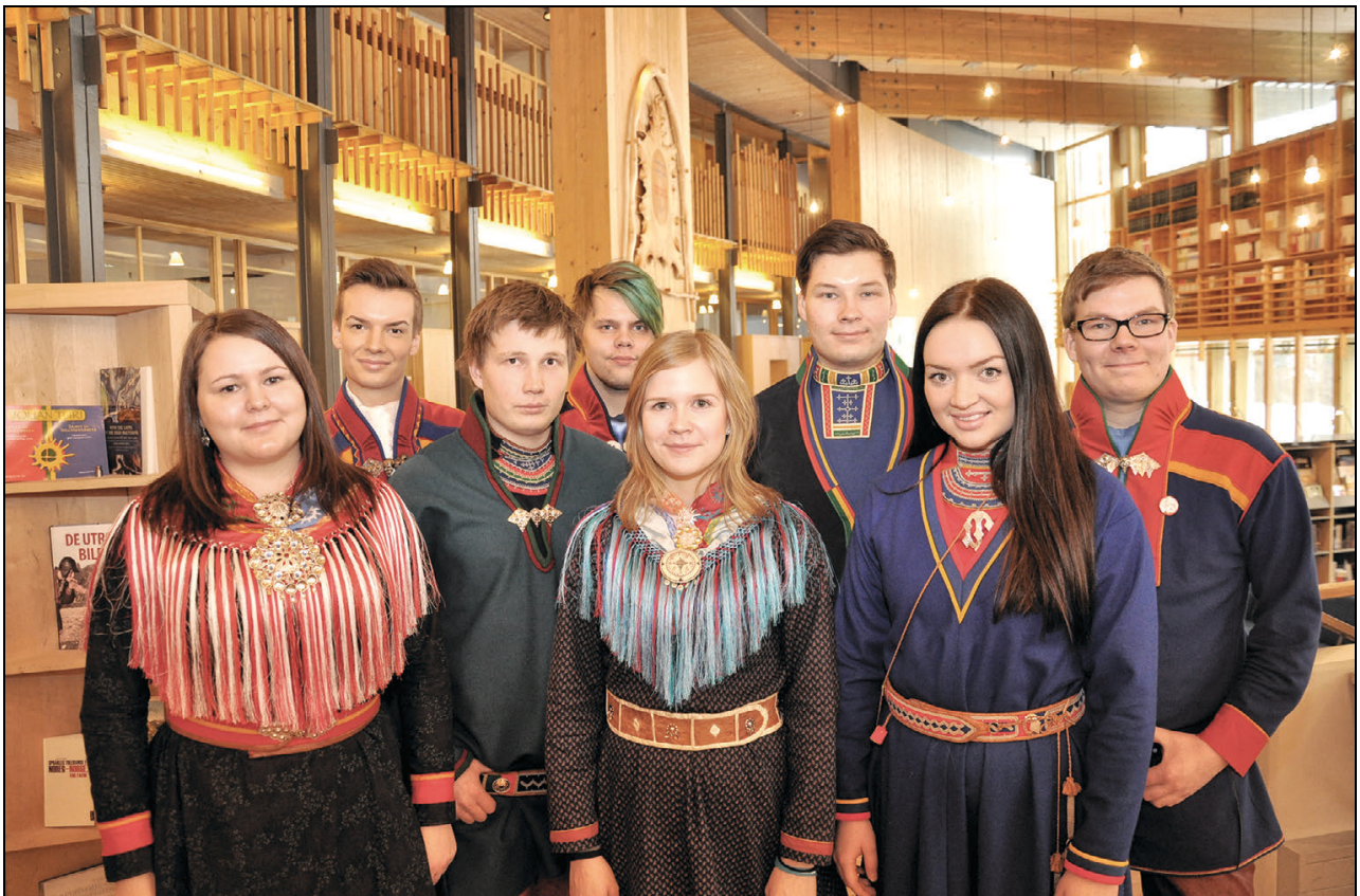
Govus 1.6 Sámedikki nuoraidpolitihkalaš lávdegoddi áigodagas 2014–2015