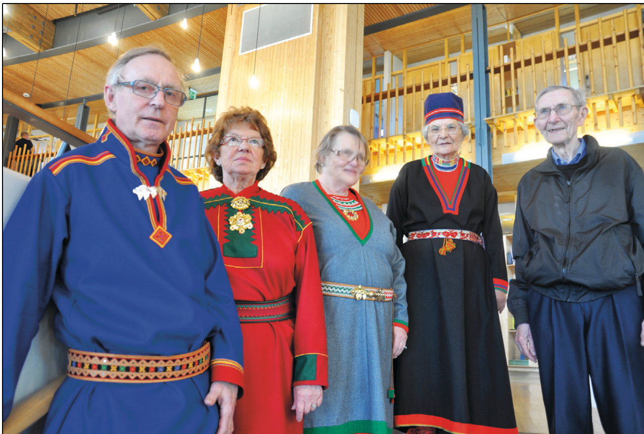
Govus 1.7 Sámedikki vuorrasiidráđđi