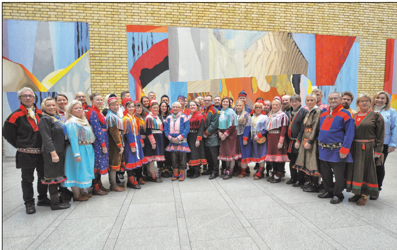
Govus 1.5 Sámediggeáirásat ja Sámediggeráđđi dievasčoahkkinnastimin Stuoradikkis čakčamánu 2015:s