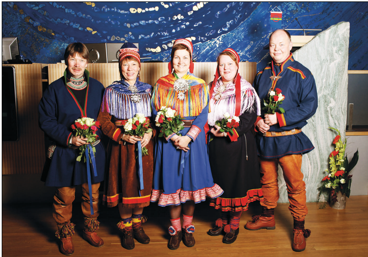
Govus 1.2 Sámediggeráddi

Fágálávdegottit leat ásahuvvon dainna áigumušain ahte ávkkástallat buot dainna sámevalitihkalaš máhtuin mii lea Sámedikki árasiiin, seammás go láchčojuvvo dasa ahte áirasat besset buorebut searvat daid áššiid ráhkkanearpmái, maid Sámedikki dievasčoahkkin galgá meannudit. Sámediggerádi, vejolaččat dievasčoahkkinjodihangotti, evttohusa vuodul lávdegottit ovddidit