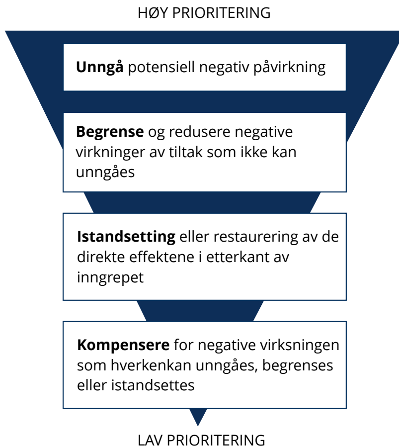
Figur 6.1 Hierarkisk framstilling av tiltak for å unngå negativ påvirkning ved utbyggingsprosjekter. Figuren illustrerer at størst gevinst oppnås ved å unngå, deretter begrense eller istandsette – og kompensasjon som siste utvei. (ref: rapporten « Fysisk kompensasjon for jordbruks- og naturområder ved samferdselsutbygging », Samferdselsdepartementet 2013).

Bestemmelsen i § 29 om å pålegge kompensasjonstiltak dersom skader på miljø eller samfunn ikke kan unngås, begrenses eller istandsettes, omfatter ikke økonomisk kompensasjon. Den er knyttet til gjennomføring av konkrete kompensasjonstiltak av fysisk karakter.