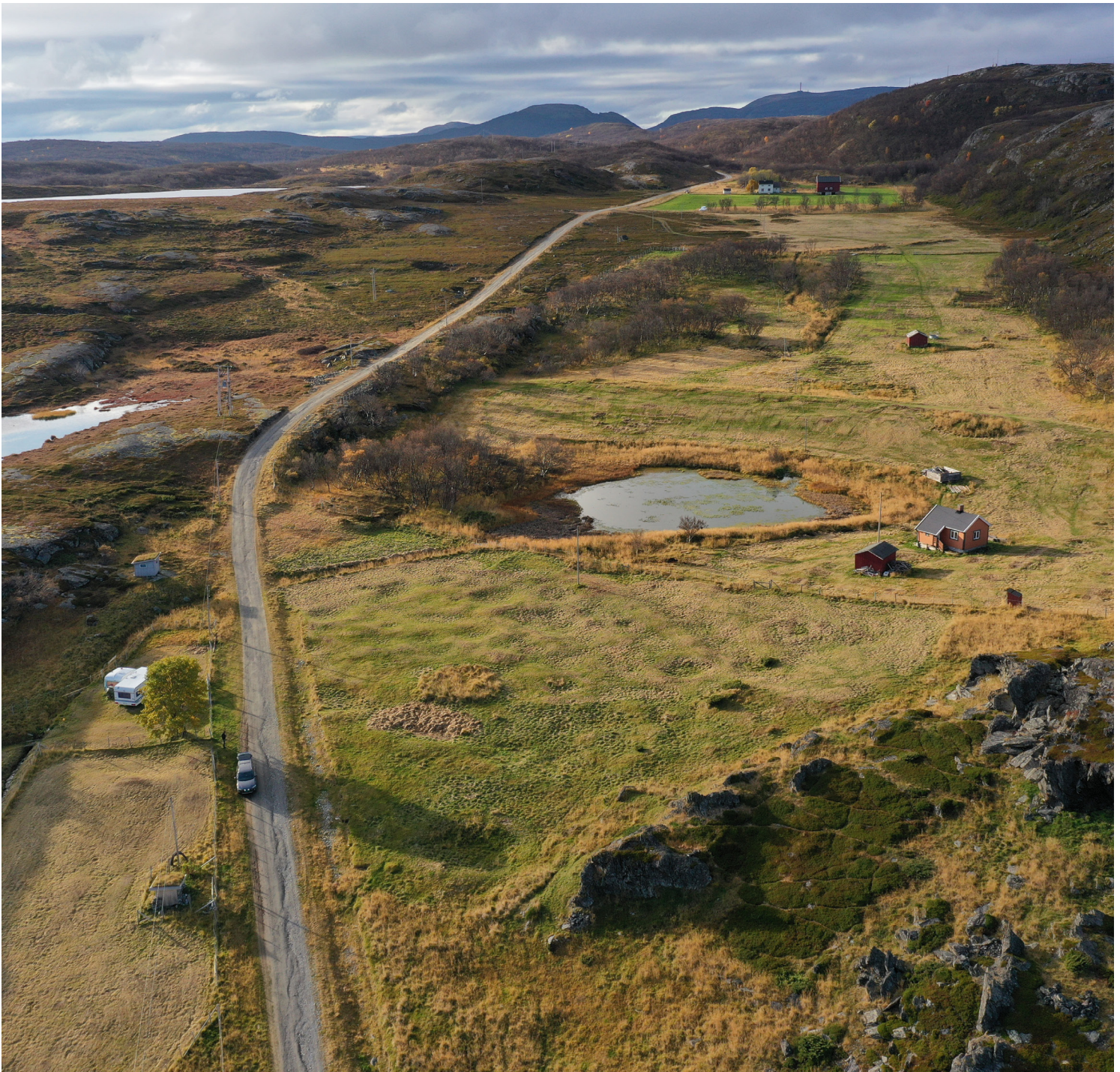
Goarahat og Sandvikhalvøya er et utvalgt kulturlandskap i jordbruket (UKL) hvor det har vært drevet jordbruk siden 1500-tallet. Her er det et stort felt med steinalderbosetning, gammetufter og artsrik naturbeitemark.

universitetsmuseene. Norsk Landbruksrådgivning kan være en viktig veiledningsaktør. Fagmiljøer som Norsk institutt for bioøkonomi (NIBIO), Norges miljø- og biovitenskapelige universitet (NMBU), universitetsmuseene og andre museer er også sentrale kunnskapspartnere.