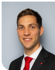
Andreas Bjelland Eriksen Klima- og miljøminister

Målet er å bevare, og samtidig finne smarte, langsiktige løsninger som gir nytt liv til kulturmiljø og som skaper verdier for fremtiden.