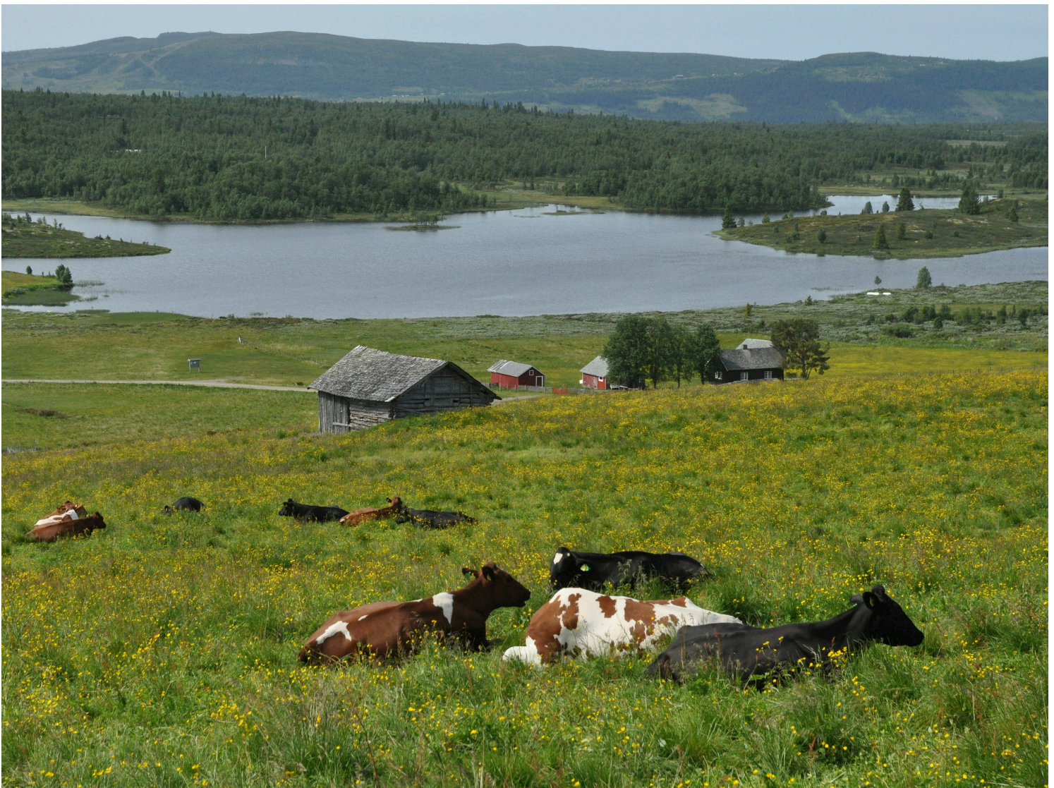
Stølsvidda i Valdres er et av de største aktive seterområdene i Norge.

Nå er enhetslåven den bygningstypen som fremstår som det tydeligste symbolet på det moderne norske jordbruket fra slutten av 1800-tallet fram til vår tid. Driftsbygningen representerer en mer lik utvikling av landbruket, der bøndene over hele landet fikk tilgang til samme kunnskap, rådgivning og løsninger. Uten enhetslåvene kan tunstrukturene svekkes, og med det forsvinner en av de mest markante kulturmiljøtypene i jordbrukslandskapet.