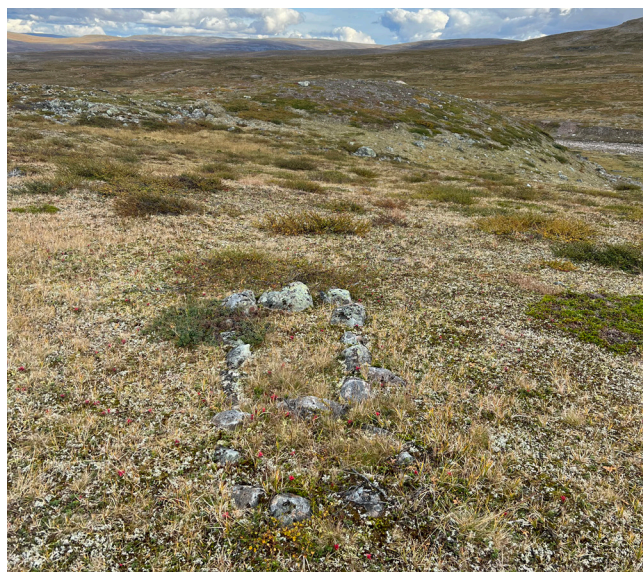
Árran (ildsted) med geađgeberpmehat, Dividalen nasjonalpark.

I løpet av 1900-tallet ble reindriften effektivisert og rasjonalisert ved å ta i bruk nye hjelpemidler og teknologi. Reindriften følger fortsatt tradisjonelt driftsmønster der aktivitetene styres av årstidene og flytting mellom årstidsbeiter. Kulturminner og kulturmiljøer etter nyere tids reindrift kan for eksempel omfatte gjerdeanlegg, næringsbygninger, boliger og gjeterhytter for kortvarig eller lengre opphold. Kulturminner er også lokaliteter det knytter seg tro, tradisjon, stedsnavn, helligsteder eller naturelementer til.