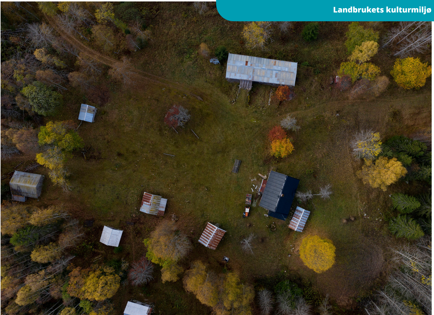
Abborhøgda i Innlandet er en fredet skogfinsk plass med elleve bygninger som trolig stammer fra 1800- og tidlig 1900-tall. Skogfinnene er en av fem nasjonale minoriteter i Norge.