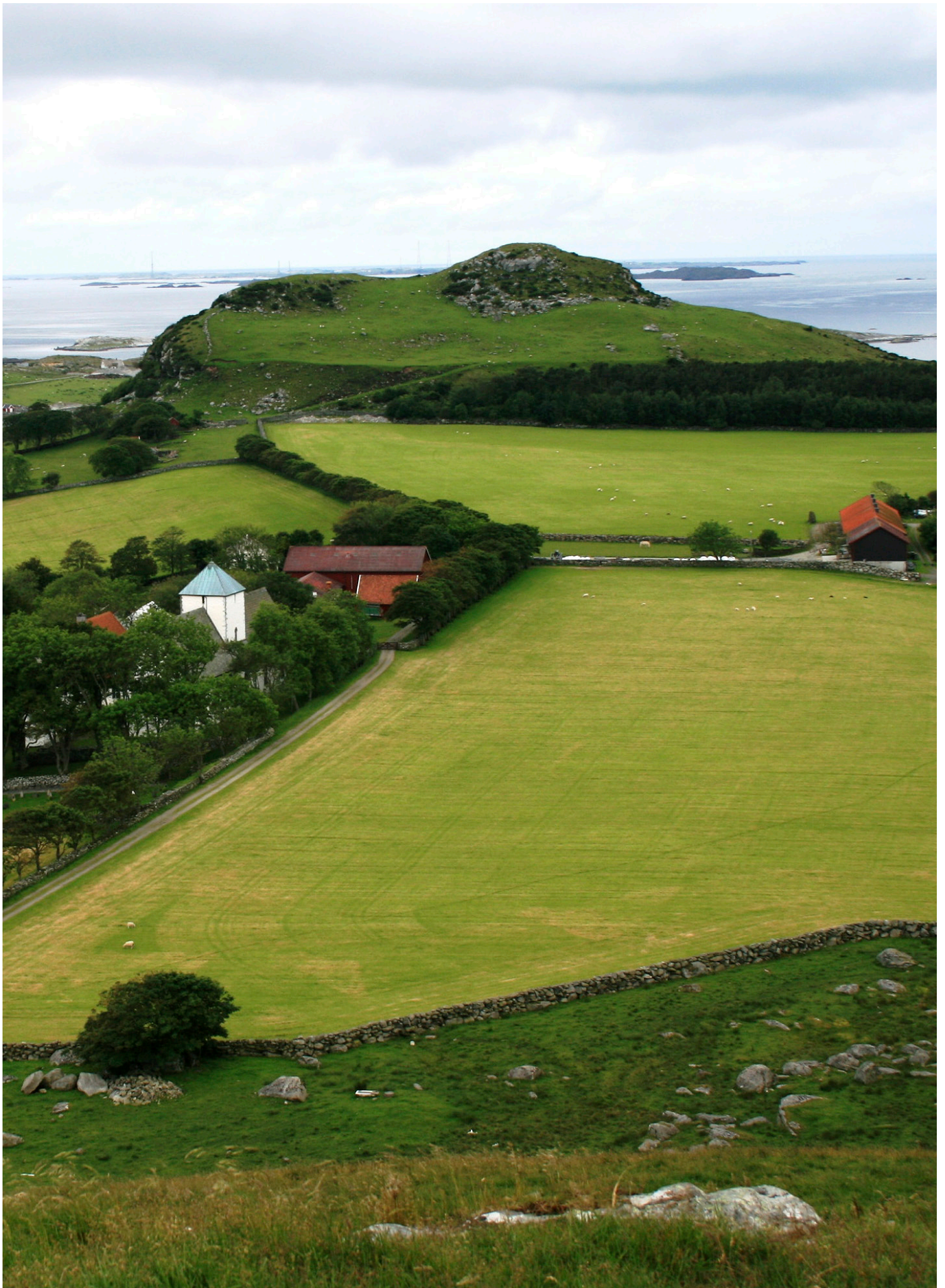
Rennesøy i Rogaland er et utvalgt kulturlandskap i jordbruket (UKL). Dette er et jordbrukslandskap med store biologiske og kulturhistoriske verdier, skapt av mennesker i samspill med naturen gjennom generasjoner.