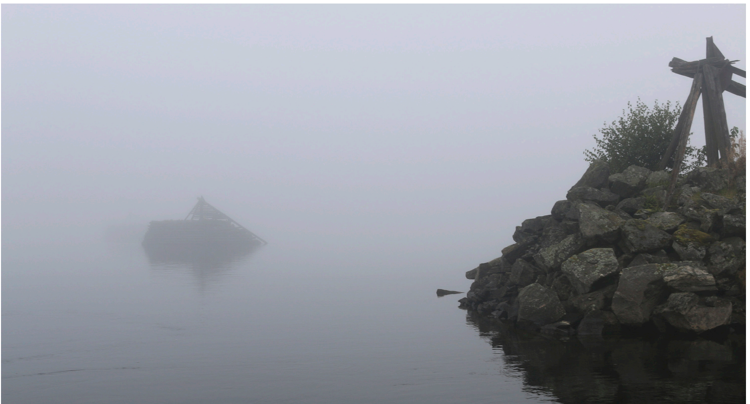
Over store deler av landet er det synlige spor etter tømmerfløting. Ved Bingen lenser ved Sørumsand i Akershus begynte den organiserte fløtingen allerede på 1500-tallet.

Disse er valgt ut fordi det knytter seg særskilte utfordringer og muligheter til områdene.