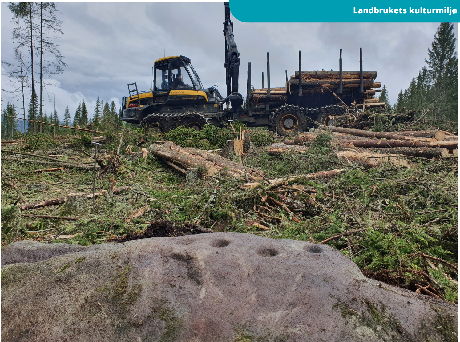
I skogen finnes det kulturminner fra alle tider. Her under hogst i et område med bergkunst (skålgroper) fra bronsealder eller jernalder.