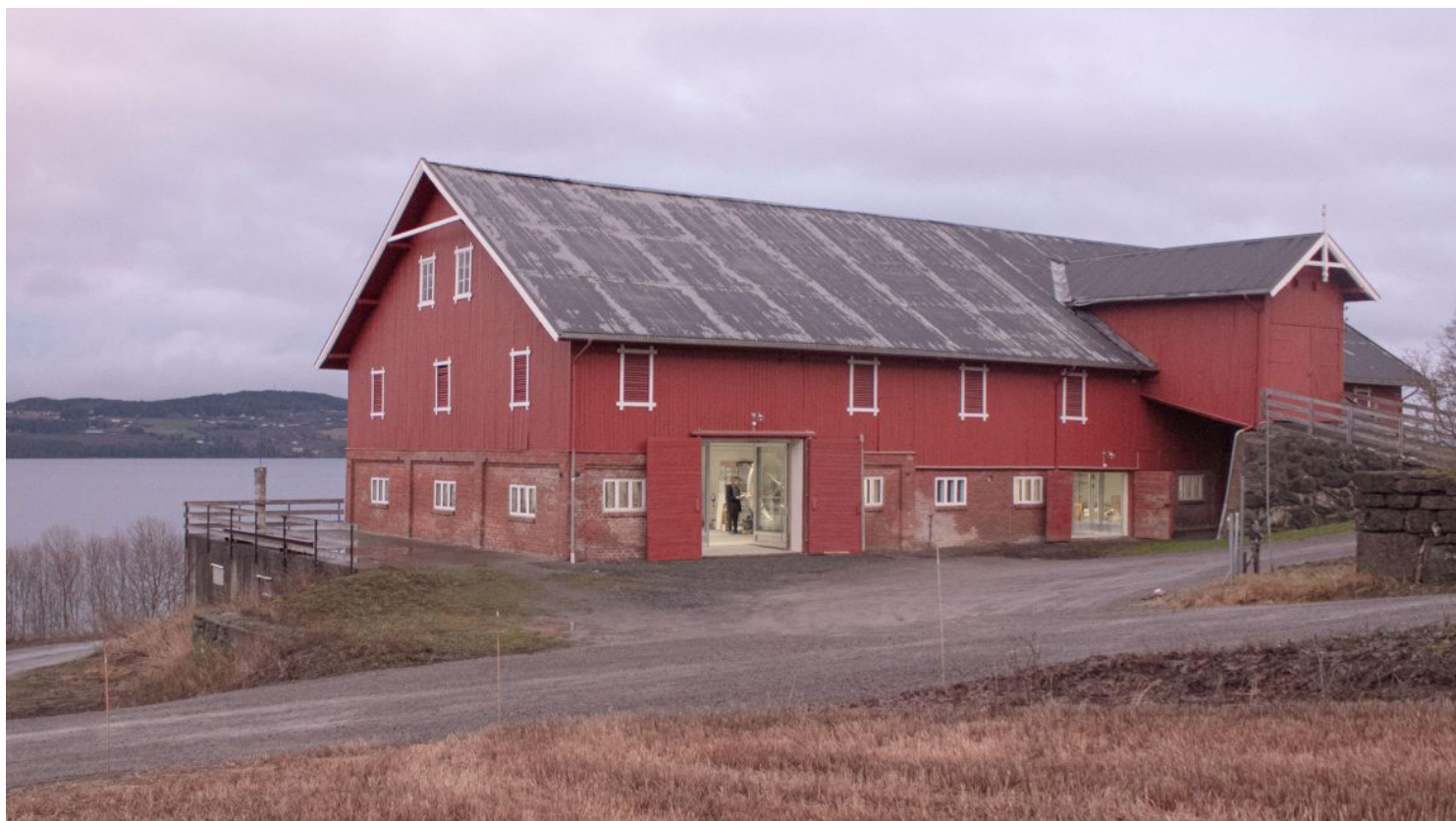
Enhetslåven på Billerud gård har fått ny bruk som atelier og utstillingslokale for Peder Balke-senteret på Toten. Eksempelet, signert Kastler Skjeseth arkitekter, viser hvordan enkle og kostnadseffektive tiltak kan tilrettelegge for ny bruk.

De fleste kulturminnene og kulturmiljøene som omtales under deltema 1 er i privat eie. Dette er i stor grad bygninger som er knyttet til aktiv næringsvirksomhet i jordbruket. Kommunene har en sentral rolle i å identifisere og samarbeide med private eiere for å finne gode løsninger. Landbruks- og kulturmiljøforvaltningens virkemidler bør ses i sammenheng slik at man kan få en effektiv og målrettet ivaretagelse av kulturmiljøene. Norsk Landbruksrådgivning, Innovasjon Norge og de regionale bygningsvernsentrene og -rådgiverne kan bidra med kompetanse og veiledning. Museer med kompetanse på formidling og bevaring av landbruksbygninger, samt miljøer knyttet til urfolk og nasjonale minoriteter, vil også være relevante aktører. Norges Bondelag, Norsk Bonde- og Småbrukarlag og Norsk Seterkultur er eksempler på relevante interesseorganisasjoner, både på nasjonalt og lokalt nivå.