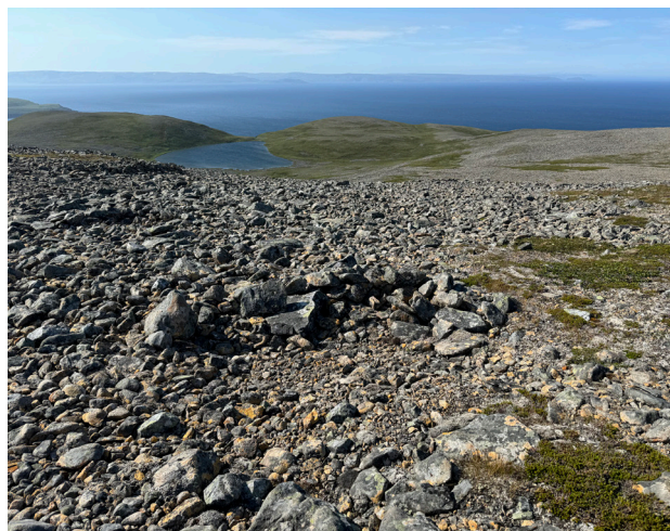
Čilla /skyteskjul, Lebesby kommune.

Sentrale interessenter og aktører som er relevante for deltemaet er reindriftnæringen med reinbeitedistriktene, reinlagene og grunneiere som Finnmarkseiendommen (FEFO), Statskog, allmenninger og private. Kartlegging og utvelgelse av kulturminner og kulturmiljøer etter reindrift og villreinfangst må gjøres i samarbeid med reindriftnæringen. Reindriftsutøvere har god kjennskap til sine bruksområder og kan gi verdifulle råd og opplysninger om kulturmiljø, herunder potensial for funn av kulturmiljø.