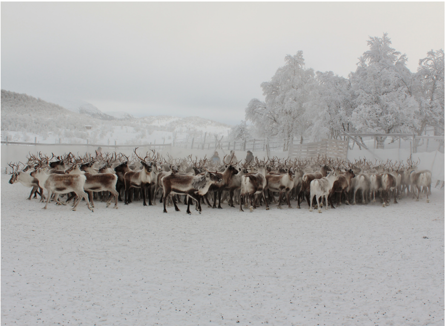
Reindriften er en landbruksnæring med dype historiske røtter i store deler av landet. Her fra reindrift i Røros, Trøndelag.