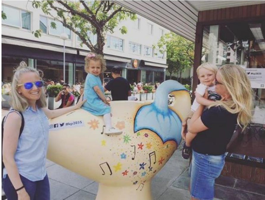
Foto fra høringskontoret i Langgata 39, også postet på #kp2035 på www.instagram.com m.fl.