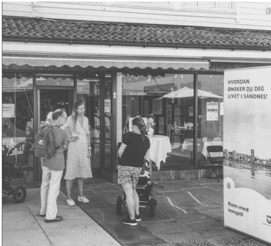
Foto fra høringskontoret i Langgata 39, også postet på #kp2035 på www.instagram.com m.fl.

Derfor arrangeres høringskontoret/utstillingen samtidig som flere andre arrangement i byrommet i Sandnes ( «Barnas by» , «Sandnesugå » og 150-års jubileum for sykkelprodusenten (DBS) og gründer Jonas Øglænd ). Noen av disse arrangementene blir gjennomført av kommunale etater, andre er av mer privat eller ideell karakter. Under vises bilder fra Langgata 39 og inngangsarealet til høringskontoret. Roll-up-plakaten har en av de 13 illustrasjonene trykket på sammen med grafisk profil til kommunen (byvåpenet i hvit silhuett).