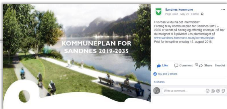
Eksempler på illustrasjoner på høringskontoret, også postet på #kp2035 på www.instagram.com m.fl.