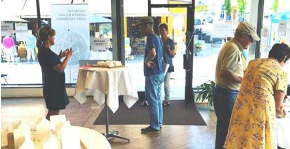
Utsnitt fra foto postet på #kp2035 på www.instagram.com – foto Harald Brynlund-Lima

Sammen med konsulentene ble det laget 3 fysiske modeller i skala 1:200, i tillegg til illustrasjonene som er benyttet i kommuneplanens samfunnsdel. Disse modellene viser tre ulike eksempler på bebygd tetthet (BRA/%BRA) med høy utnyttelse med ulike løsninger for parkering, uterom og utforming. .