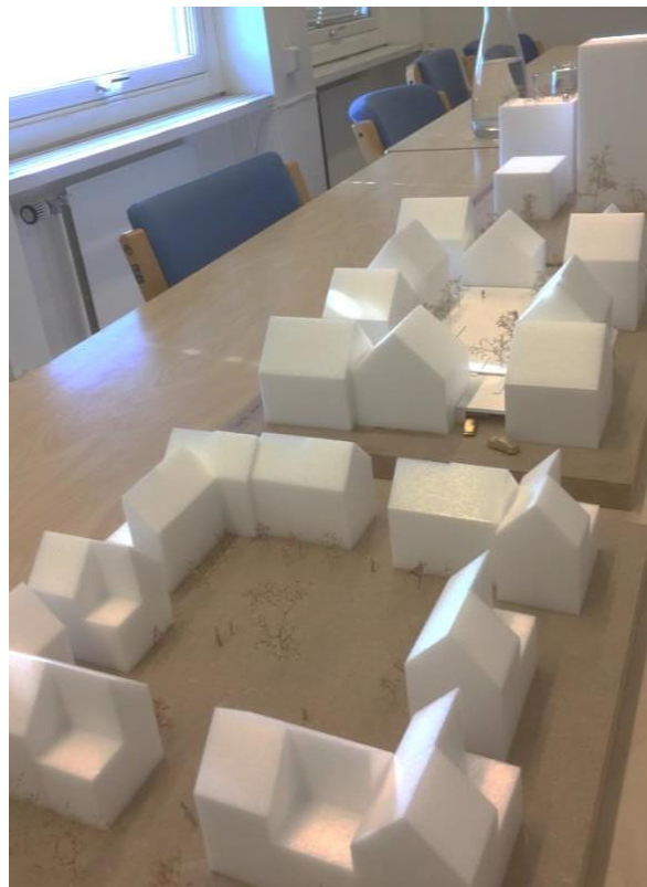
Foto av modeller ved levering til rådhuset

Modellene er benyttet som eksempler og drøftingsgrunnlag i den offentlige utstillingen/åpne kontordager/pop-up om ny kommuneplan og i ordskifte med interesserte innbyggere som besøker høringskontoret.