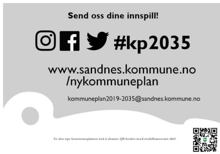
Eksempel på illustrasjoner på høringskontoret, også postet på #kp2035 på www.instagram.com m.fl.

Prosjektgruppa mener illustrasjonene i prosjektet faktisk har senket terskelen for innbyggers deltakelse i høring og offentlig ettersyn. Oppsummert, kommunen har gjort seg positive erfaringer med sosiale medier som har betydelig overføringsverdi til annet planarbeid, også for andre kommuner. Under vises noen eksempler fra sosiale medier: