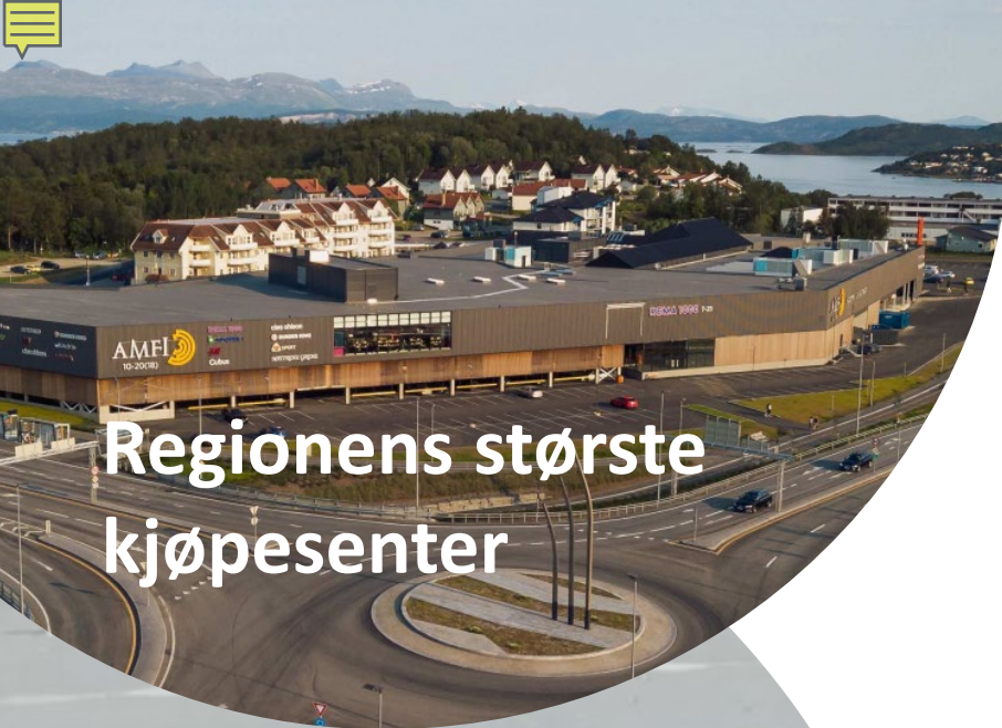
Regionens største kjøpesenter

Hva er fellesnevneren for disse prosjektene?