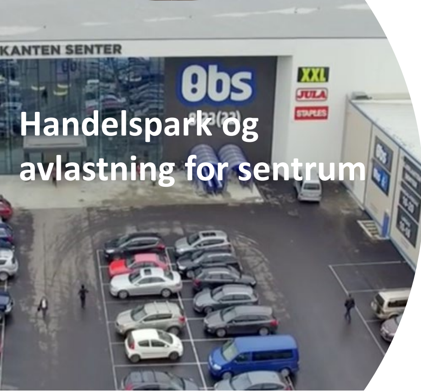
Handelspark og avlastning for sentrum