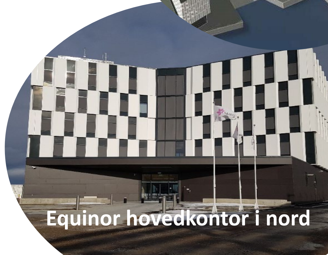
Equinor hovedkontor i nord