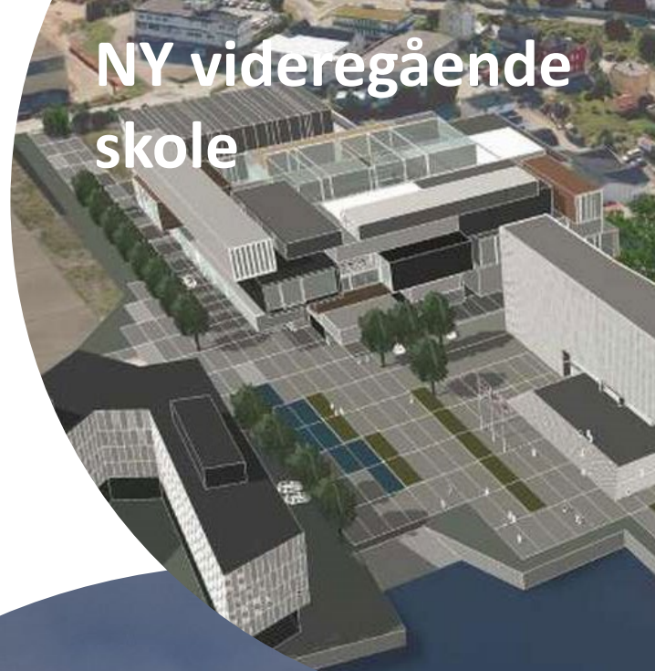
NY videregående skole

Hva er fellesnevneren for disse prosjektene?