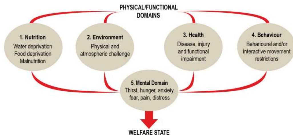
Figure 1. The 1994 Five Domains Model, redrawn from Reference [1].

Definisjonen av dyrevelferd, og forståelsen av hvilke forhold og perspektiver som inngår, har vært i utvikling parallelt med utviklingen av dyrevelferd som fag. Stortingsmeldingen må avspeile dette. Vi vil peke på livskvalitetsperspektivet, som fokuserer på at god dyrevelferd oppnås når dyr opplever å ha et liv verdt å leve, der risikoen for negative opplevelser reduseres og mulighetene for positive opplevelser økes, som en oppdatert og operativ definisjon (Mellor 2020). Denne tilnærmingen rommer også en helhetlig forståelse av alle forhold som må ivaretas for å sikre god velferd og trekker dermed også linjene tilbake til den oppdaterte forståelsen av de fem friheter (Webster 2016). Denne definisjonen gir samtidig grunnlaget for å vurdere hvorfor det i noen produksjoner og dyregrupper er mulig å oppnå bedre velferd i et kontrollert og tilrettelagt husdyrrom enn ved utedrift.