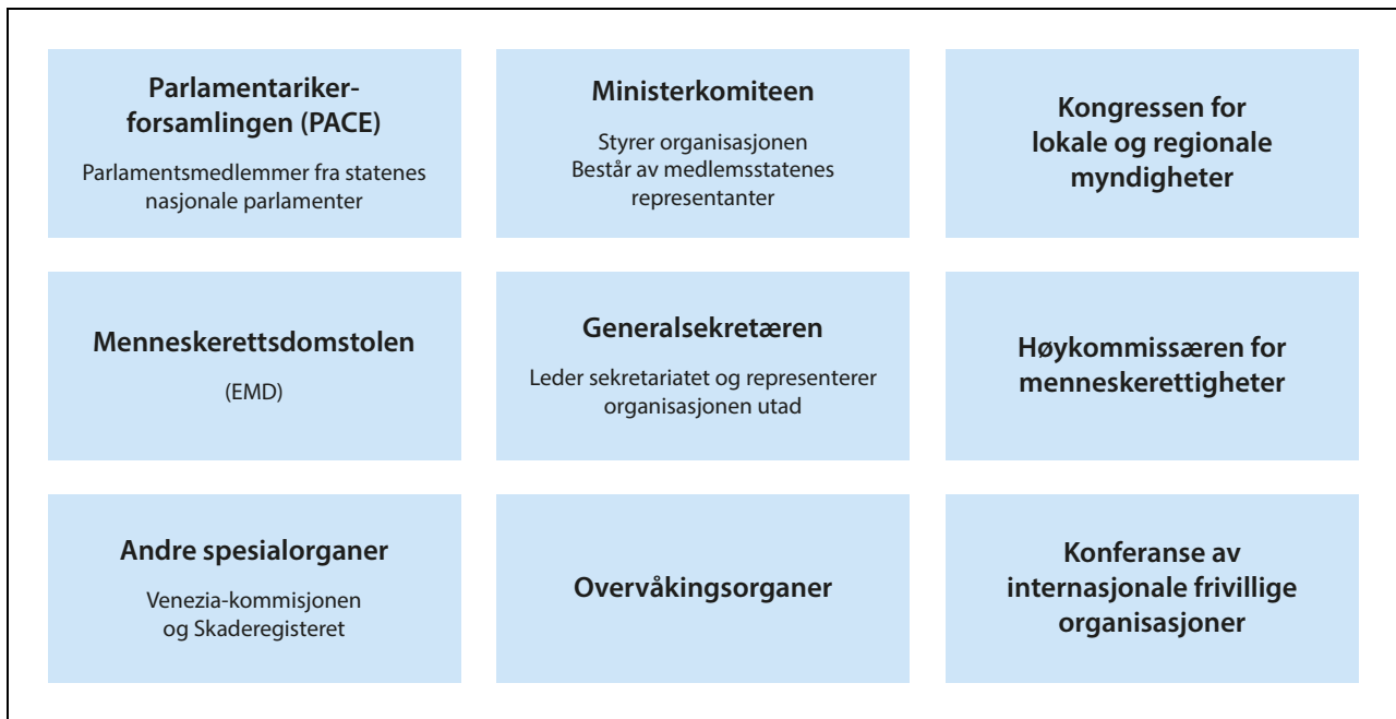
Figur 3.2 Europarådets organisasjon