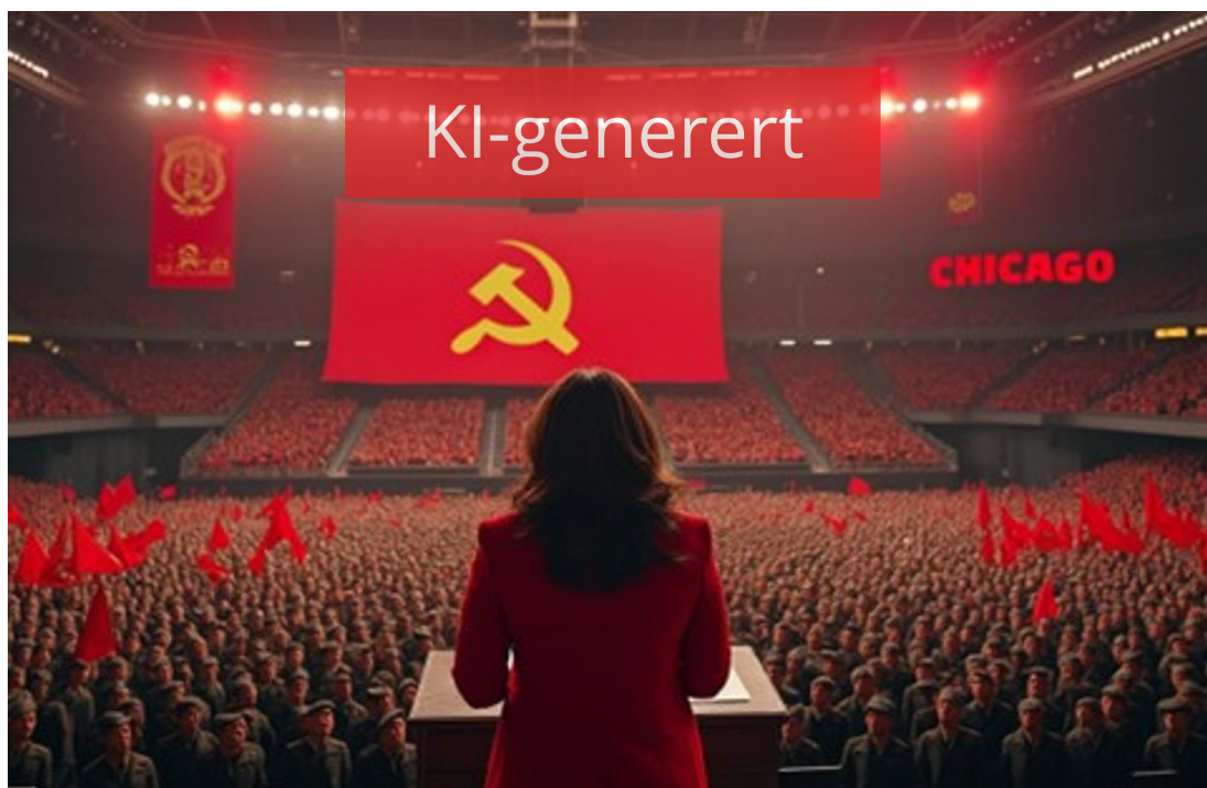
Figur 4.6 KI-generert bilde som fremstiller Kamala Harris som kommunist. Ekspertgruppens merking.