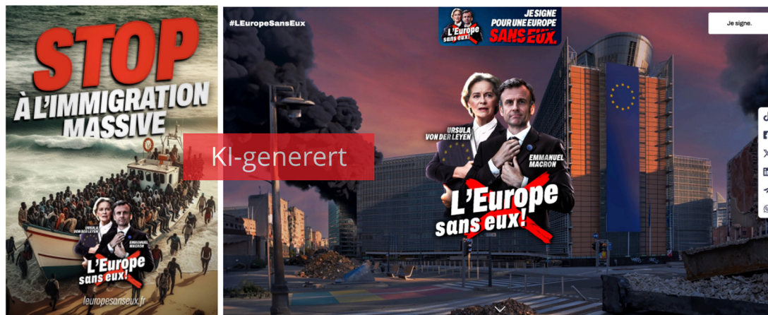
Figur 4.1 Eksempler på KI-generert innhold fra kampanjen «L'Europe sans eux!». Ekspertgruppens merking.

institusjoner, protester og eksplosjoner. Ifølge Meta Ad Library, gjengitt av DFRLab, fikk videoen en rekkevidde på 29 406 på Facebook og Instagram. 93