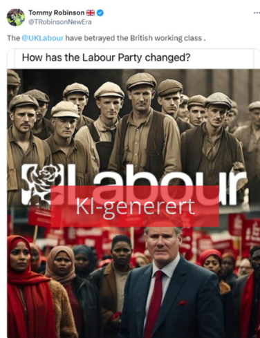
Figur 4.3 KI-generert bilde delt av ytre høyre-aktivisten Tommy Robinson på X. Ekspertgruppens merking.