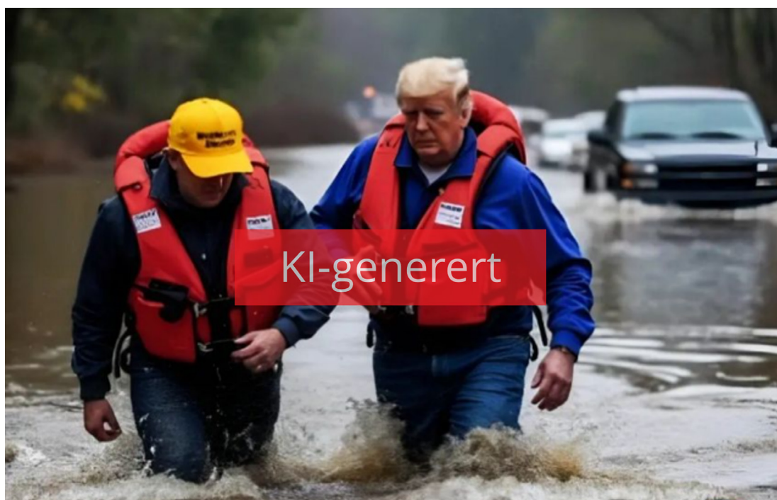
Figur 4.5 KI-generert bilde av Donald Trump som sirkulerte i forbindelse med orkanen Helene. Ekspertgruppens merking.

I forbindelse med orkanen Helene, som rammet USAs sørøstkyst bare noen uker før valget, ble det delt bilder som fremstilte Donald Trump til stede i områdene som var rammet. Bildene fikk stor spredning, til tross for at det raskt ble avslørt at bildene var falske. 114 Innholdet bidro til å forsterke følelser og inntrykk, og understøttet subjektive oppfatninger av virkeligheten slik man kan mene eller oppfatte at den er. Dette viser at KI kan forsterke oppfatninger selv om mottakeren forstår at innholdet er falskt.