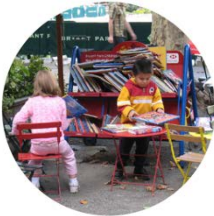
/ Fortett byene med urbane kvaliteter og funksjoner