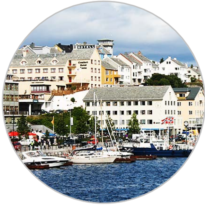
KRISTIANSUND OG OMLANDET

” Ønsket om byutviklingsprosjekt kom frå byane og nabokommunane