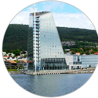
MOLDE OG OMLANDET