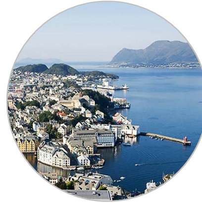
ÅLESUND OG OMLANDET