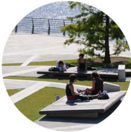
/ Byer som aktivum for hele fylket