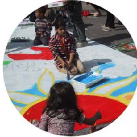
/ Synliggjør prosessen og involver flere